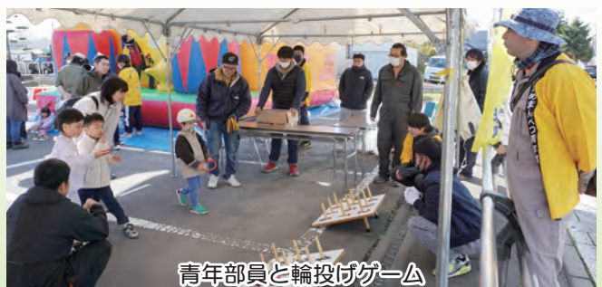
青年部員と輪投げゲーム