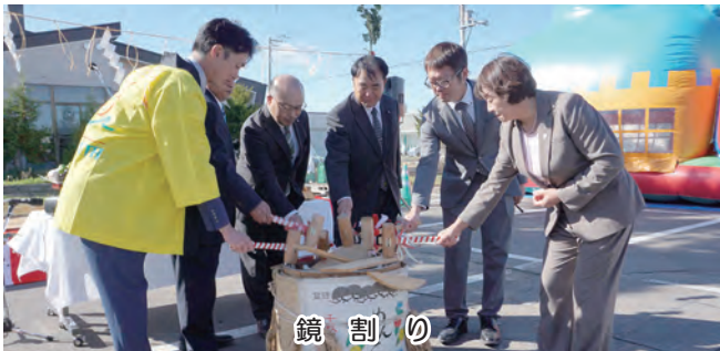
鏡 割 り