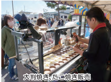
六判焼き、たこ焼き販売