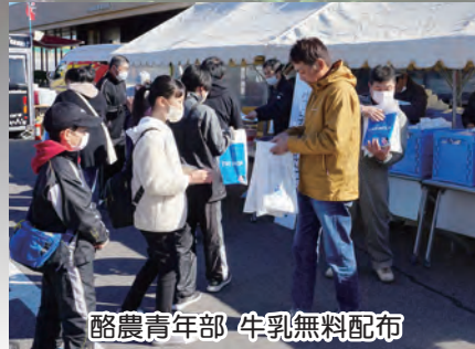
酪農青年部 牛乳無料配布