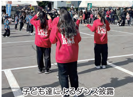
子ども達によるダンス披露