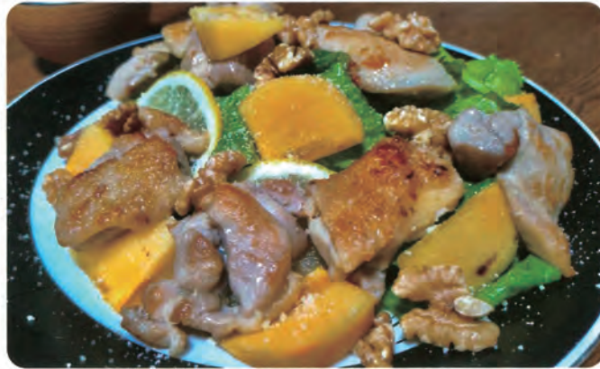
鶏モモ肉と柿、 ロメインレタスの サラダ