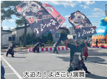
大迫力！よさこい演舞