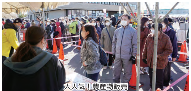
大人気! 農産物販売