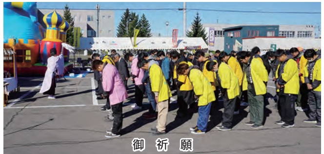
御 祈 願