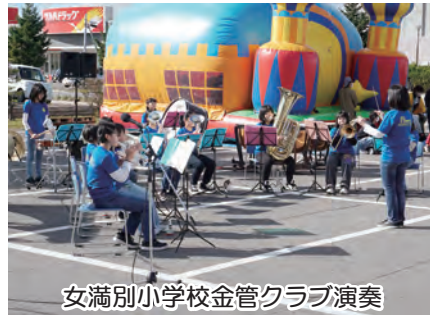
女満別小学校金管クラブ演奏