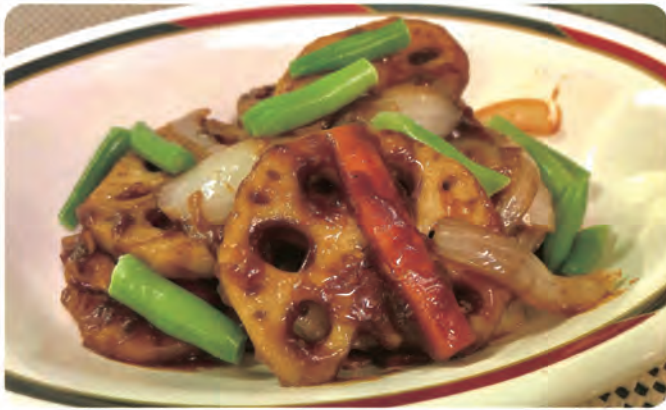
レンコンと豚バラ肉の オイスターソース炒め