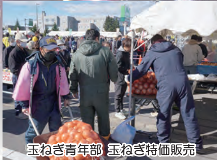
玉ねぎ青年部 玉ねぎ特価販売