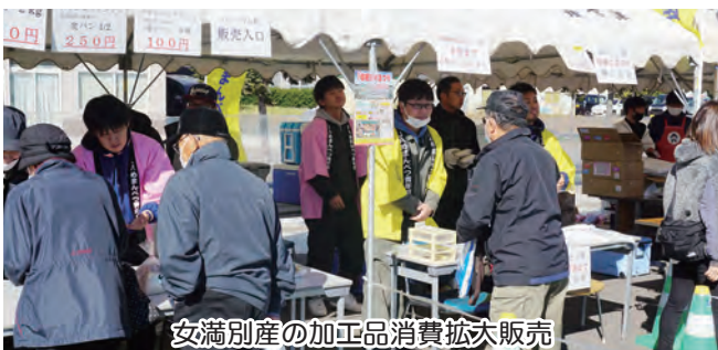
女満別産の加工品消費拡大販売