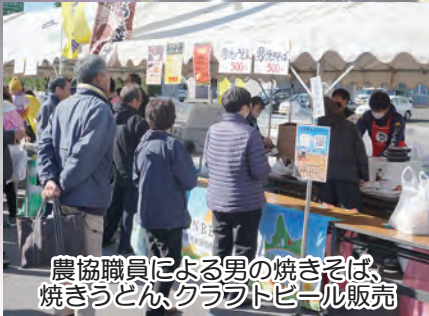
農協職員による男の焼きそば、 焼きうどん、クラフトビール販売