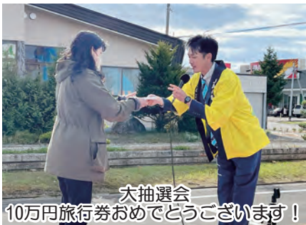
大抽選会 10万円旅行券おめでとうございます！