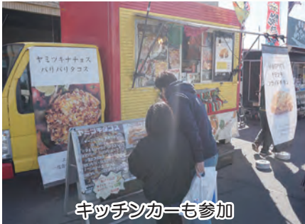
キッチンカーも参加