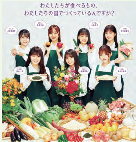
わたしたちが食べるもの、 わたしたちの国でつくっている人ですか？

特設WEBサイトで展開するクイズコンテンツを 用いて、国内農業が抱える諸課題（生産基盤の弱体化 食料自給率の低迷等）について、乃木坂46のメンバ ーがわかりやすく解説しており、メンバーと楽しく 学べるスタイルとなっております。その他、メンバ ーからの国内農業に対する応援メッセージの掲載や、 メンバーがそれぞれの「推し食材」を食べる動画も 公開しておりますので、是非ご覧ください。