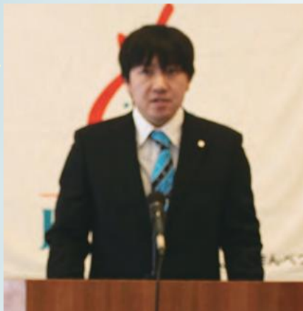
村田部長あいさつ