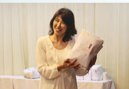
おめでとうございます!!