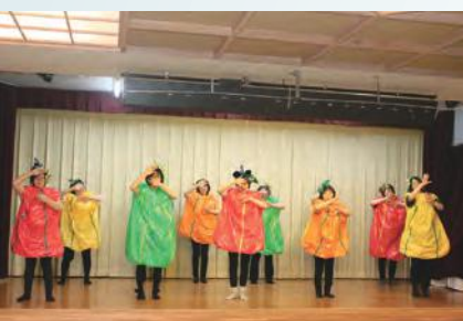
パプリカ花が咲いたら～♪