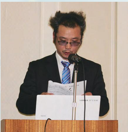
各部会・支部報告③