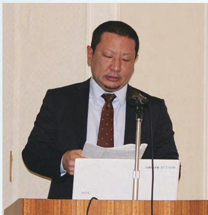
各部会・支部報告④