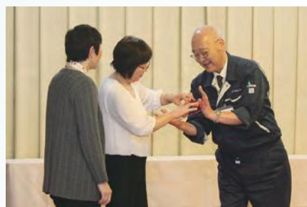
大変ご迷惑をおかけしました(笑)