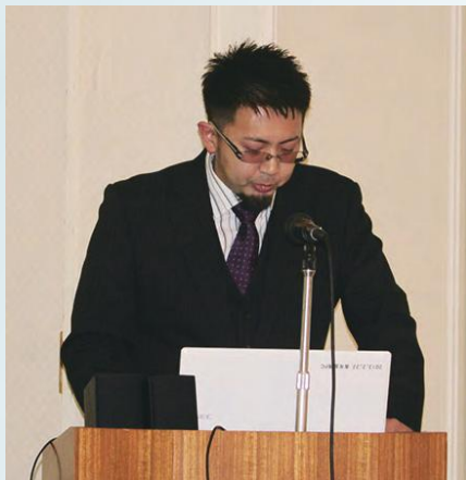
各部会・支部報告①