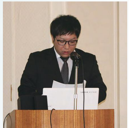
各部会・支部報告②