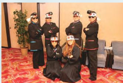
「俺んどこに来ないか?」