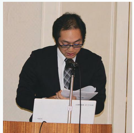
各部会・支部報告⑤