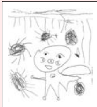
▲朝日地区：あずきちゃん