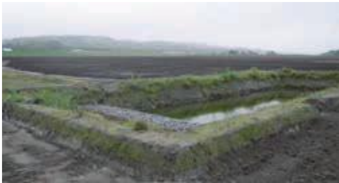
沈砂池により河川への土砂流失を防ぐ ※昨年掲載したものを再掲載しております。

また、小規模な崩落であれば自力施工という方法もあります。なるべく経費をかけずに効果的な防災減災整備が出来るようJAや市町村、振興局が検討しますので、気軽に相談して下さい。