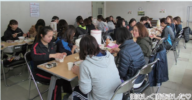
美味しく頂きました♡

フレッシュミズの参加にご協力いただきました、ご家族の皆様ありがとうございました。また、今後ともご協力よろしくお願いいたします。 JAめまんべつ 営農課