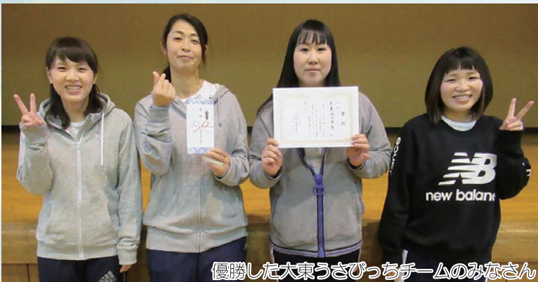
優勝した大東うさびっちチームのみなさん