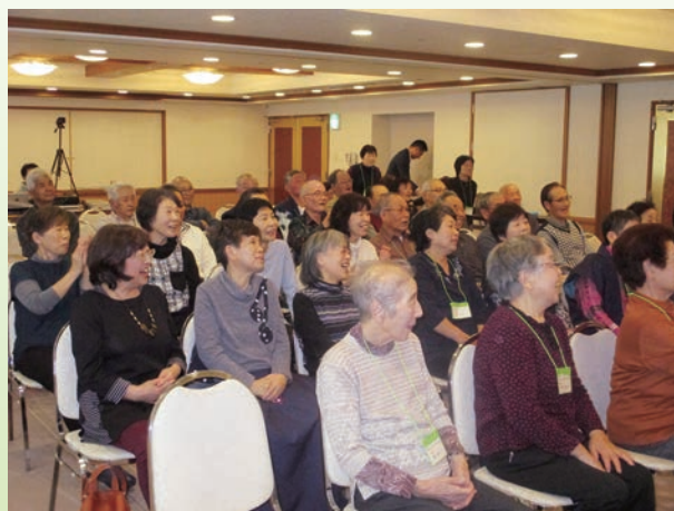
バルーンアートショーの様子