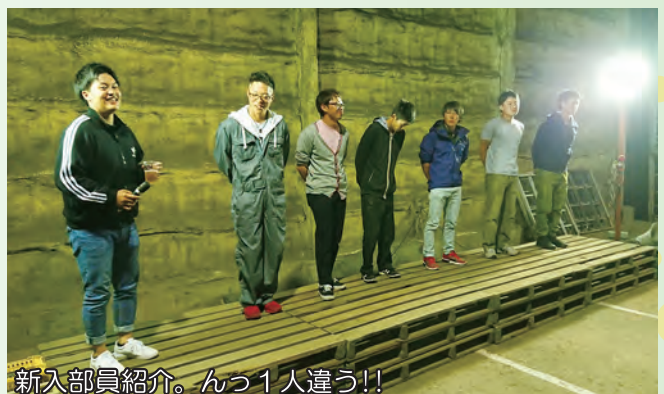
新入部員紹介。んっ1人違う!!