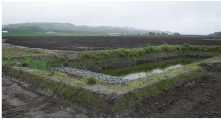
沈砂池により河川への土砂流失を防ぐ

く経費をかけずに効果的な防災減災整備が出来るようJAや市町村、振興局が検討しますので、気軽に相談して下さい。