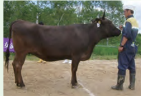
経産最高位「あつただ22」

【和牛の部】上位入賞牛は7月27日（金）に、開催される北見管内総合家畜共進会に出品予定です。