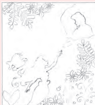
ありさ●まますんの1番下の娘「ありさちゃん」が書きました。

私は課の紹介が一番楽しみです。何年かおきなんだろうけど課の紹介楽しみにしています。 ペンネーム ありさ●まますんより