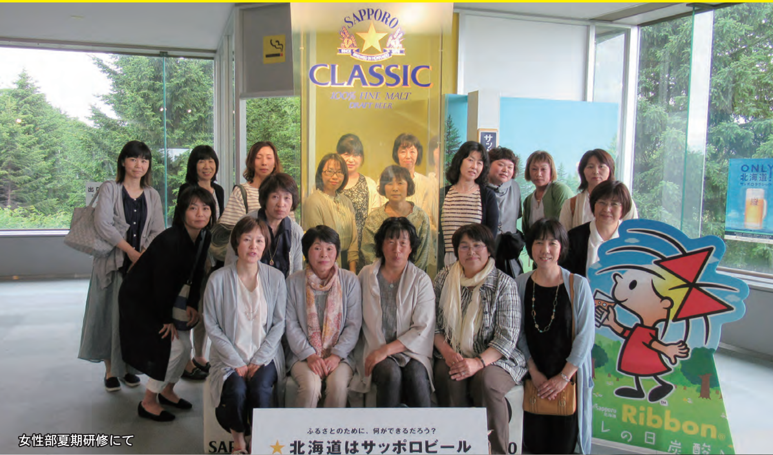
女性部夏期研修にて