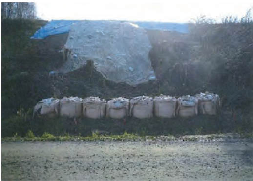
シートや土嚢で応急的に補修した農地

簡易補修の方法としては、崩落場所が雨で浸食されないようブルーシートで覆う、土嚢を作って土の流出を防ぐといったものがあります。土嚢用の袋をJAで無料配布したり、土嚢作りや積み方の研修会を行って