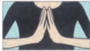
(2) 左右から押しながら指を反らします。手のひらは付けず指先から指の根元までを合わせます。