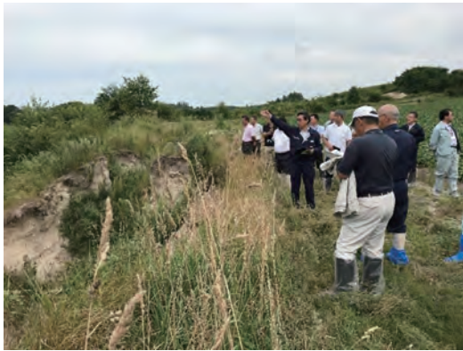
農地崩落対策プロジェクトチームの現地調査

もあります。農地崩落は農業者と漁業者の両方にマイナスの影響を及ぼすものです。農地崩落を自らの問題としてとらえ、ともに地域に生きる生産者がお互いに力をあわせながら、地域の大切な農村空間と河川、湖沼、海を一体として後生に引き継ぐことが重要なのではないのでしょうか。