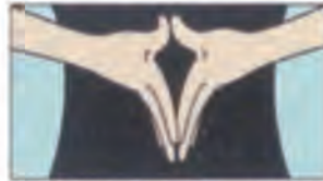
(4) 指先を気持ち良く反らせる方向を探してみましょう。(1)から(4)までをゆっくり数回繰り返します。