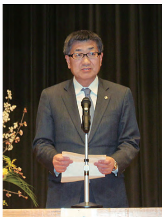
ホクレン今野支所長