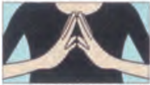
(1) 背筋を伸ばし、胸の前で左右の指先を合わせます。