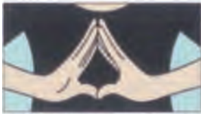
(3) そのまま指先の向きを少し変えてみましょう。中指の先を自分の胸に向けてみます。