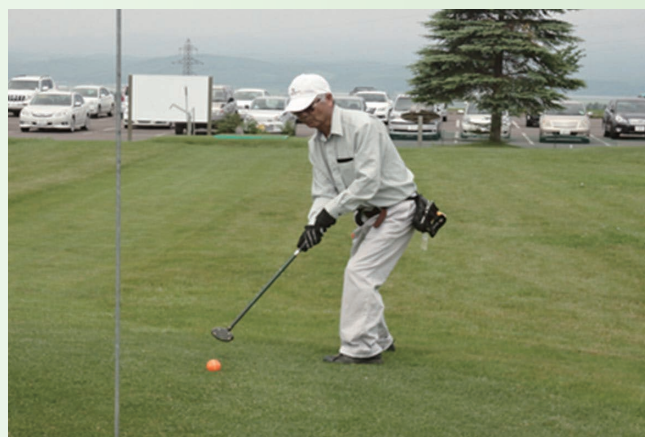
場所：朝日パークゴルフ場