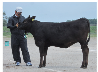
第1部1等2席 さくら号