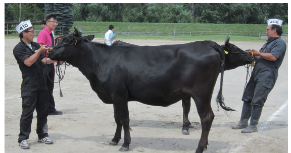
手前 第4部1等1席 しんいとかつ号 奥 第4部1等2席 きたざくら号