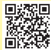
スマートフォン版