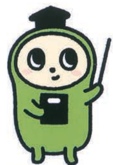
日本語検定公式キャラクター にほん