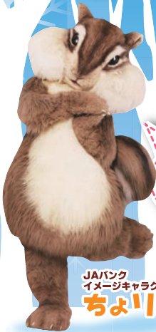
JAバンク イメージキャラクター ちよリス