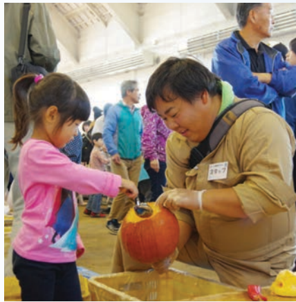
上手にできるかな?

10月15日(土)、サンドーム北見でオホーツク農協青年部協議会主催のオホーツク農業祭2016が開催されました。オホーツク農畜産物のPRや消費者と生産者との交流を目的として開催しており、毎年オホーツク管内の各農協青年部員が地場農畜