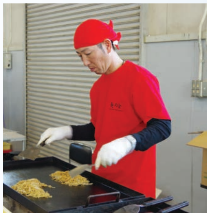
焼ラーメン大好評