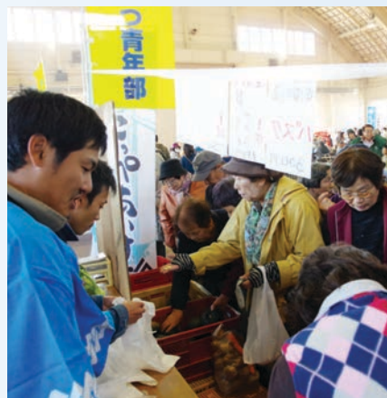
あっという間です!!

産物の販売をしています。今年は過去最高の来場者数2000人を突破し、会場は大変混雑していました。本年度もJAめまんべつ青年部と麵の会が出店いたしました。今年は農産物高騰の影響か農産物を買いたい求める行列ができ、めまんべつブースも瞬く間に馬鈴薯、人参、ブロッコリー、かぼちゃと完売いたしました。