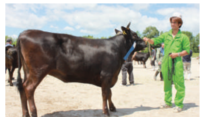
4部1等1席 たかゆり号