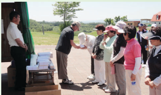
場所：朝日パークゴルフ場