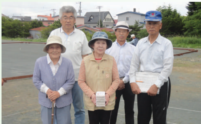
場所：昭和ゲートボール場 ゲートボールの様子 (7月15日)