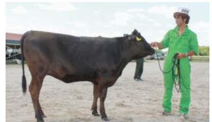
3部1等1席 ひゃくやす号