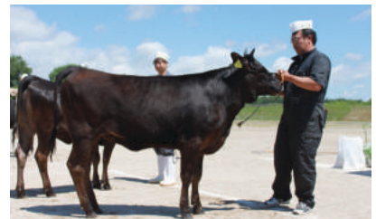
1部1等1席 ふくかつ号

1部入賞牛につきましては、次世代の北海道和牛を担っていく【勝早桜5】の産子であり、3頭1群の父系群を構成し、上位入賞牛と共に9月4日(日)、音更町で開催される第32回北海道肉用牛共進会に出品し、当組合和牛改良の成果をアピールする予定です。