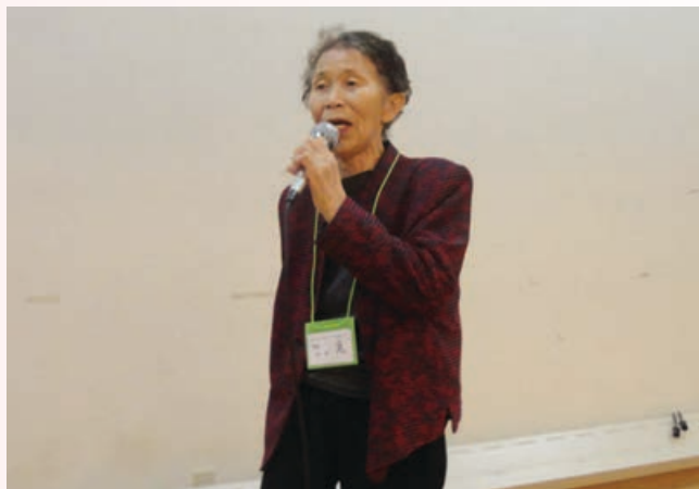
カラオケ大会の様子