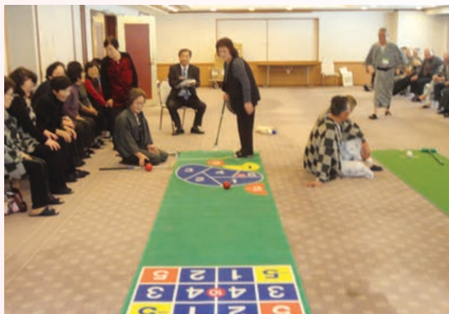
スカットボール大会の様子