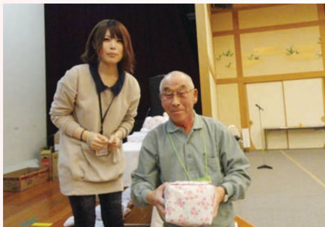
ビンゴ大会の様子