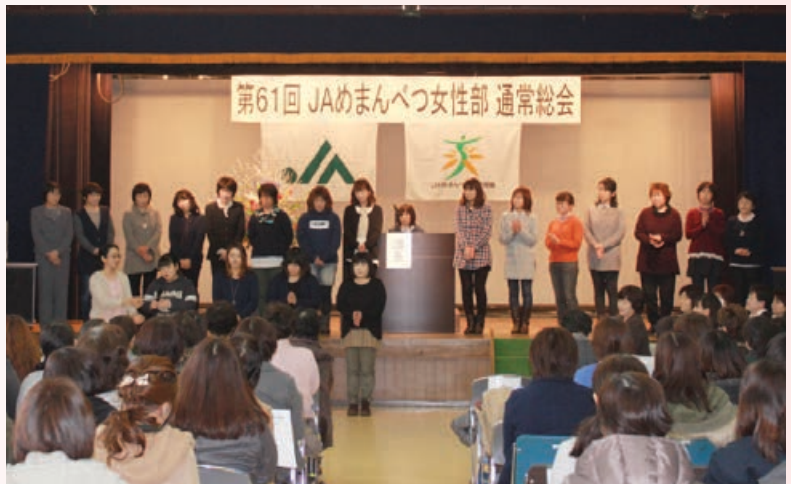
新役員のみなさん