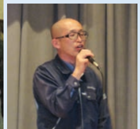
JA職員によるカラオケ