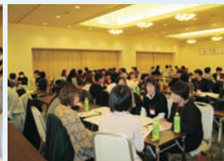
グループ討議の様子