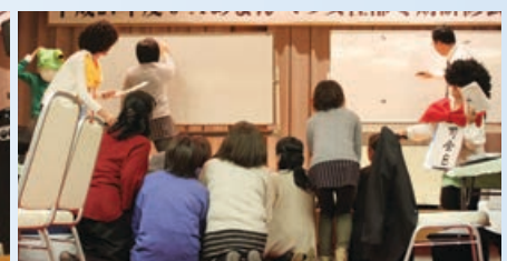
大東支部による奥さんお絵描きですよ!