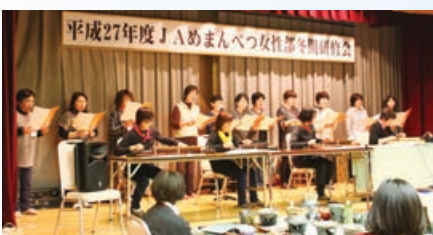
湖南・朝日支部合同での琴と歌