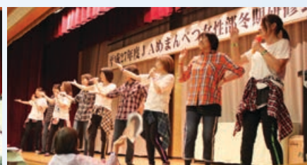
大成支部による嵐コンサート