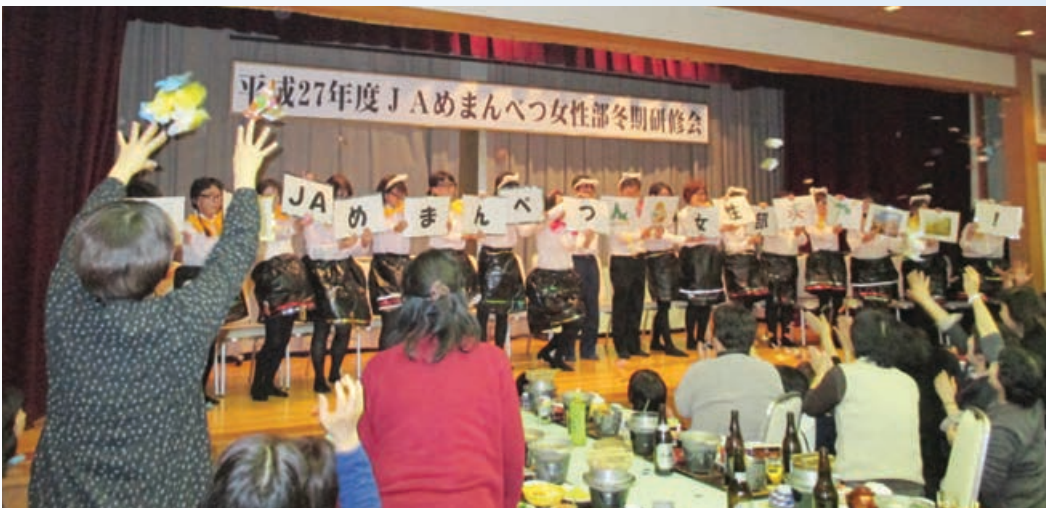
女性部役員によるダンス