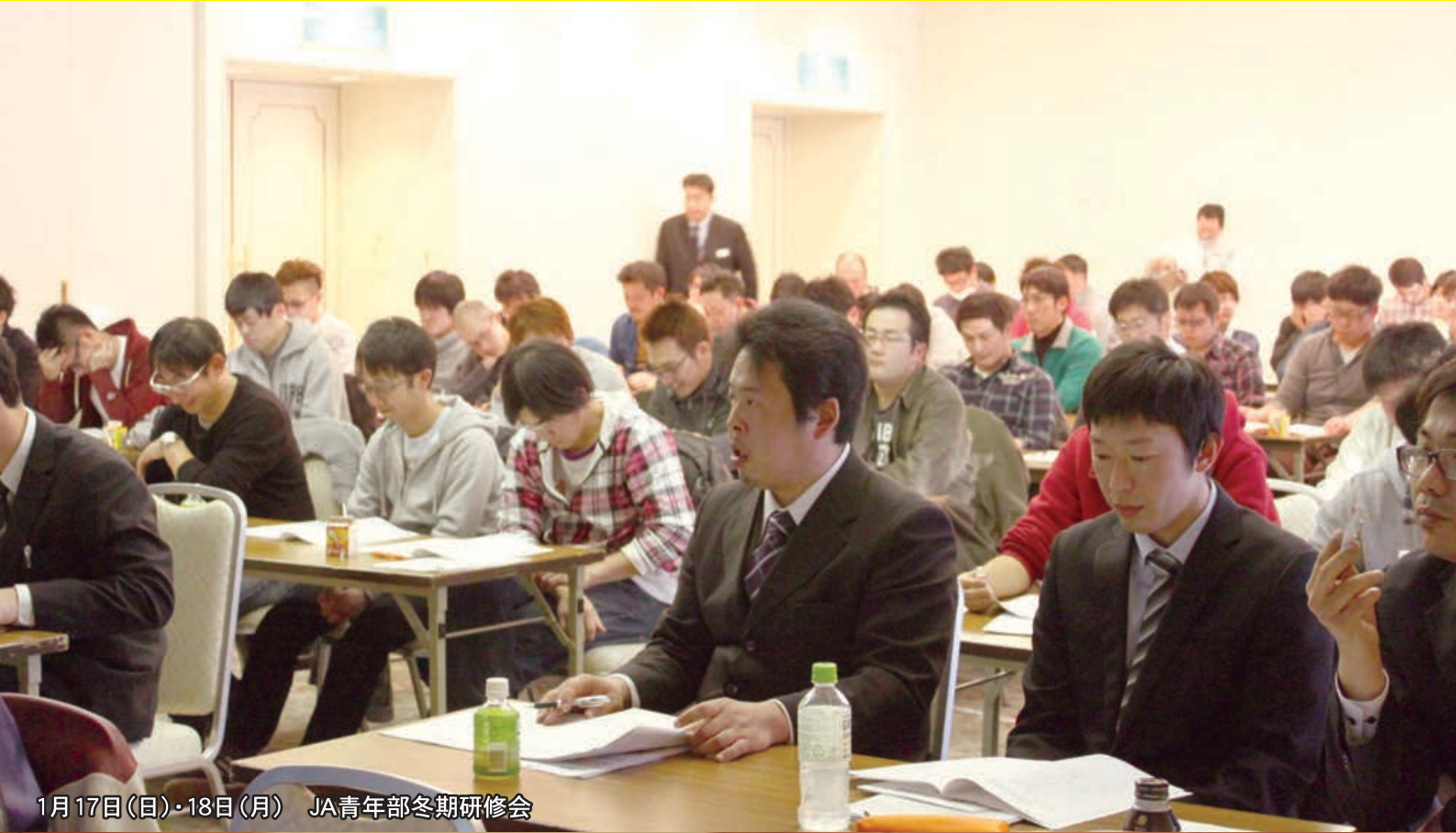
1月17日(日)・18日(月) JA青年部冬期研修会