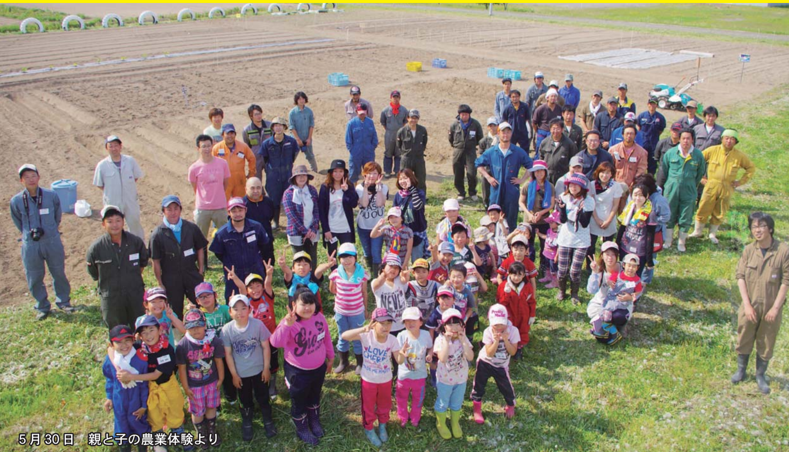
5月30日 親子の農業体験より