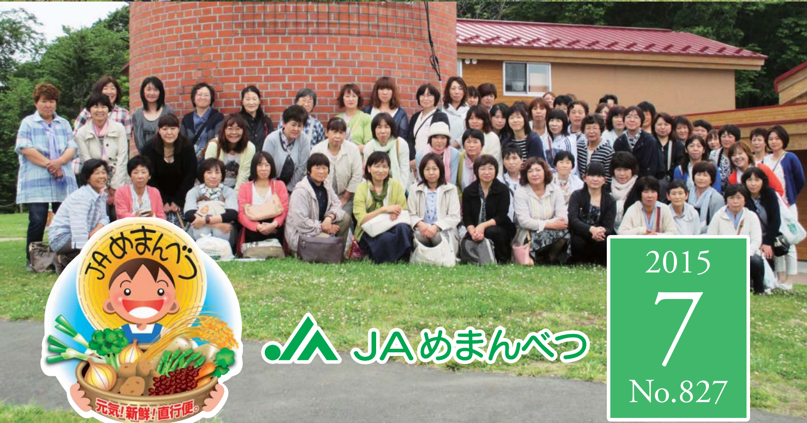
6月24日・25日 女性部夏期研修会