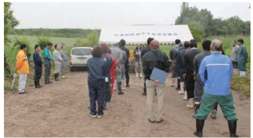
開 会 式