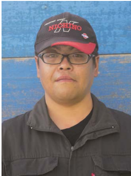
こう とう のり かず 向 当 法 和