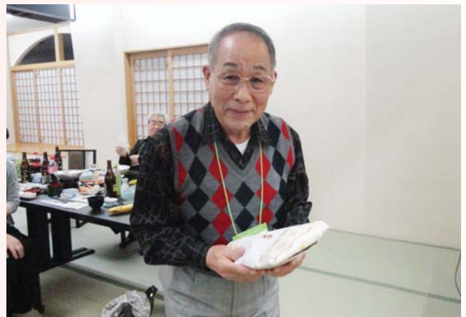
ビンゴ大会の様子