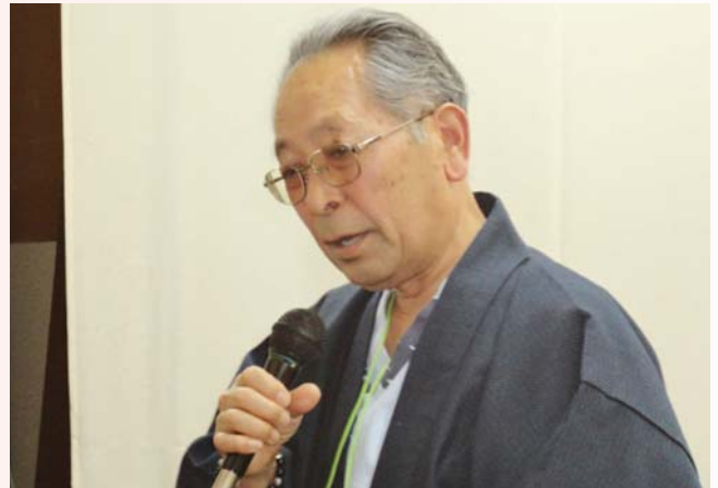
カラオケ大会の様子