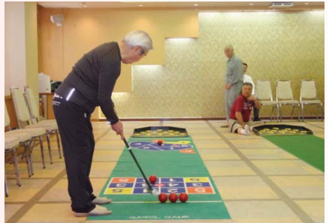
スカットボール大会の様子