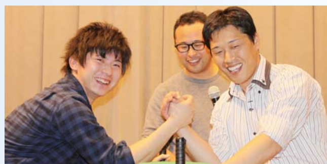
余興(アームレスリング)