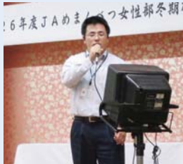
JA職員によるカラオケ