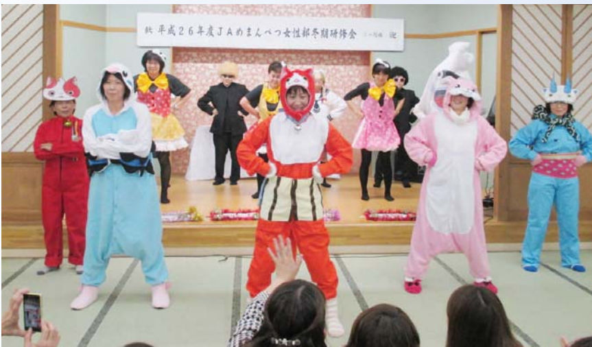
女性部役員による妖怪ウォッチの「ようかい体操第一」