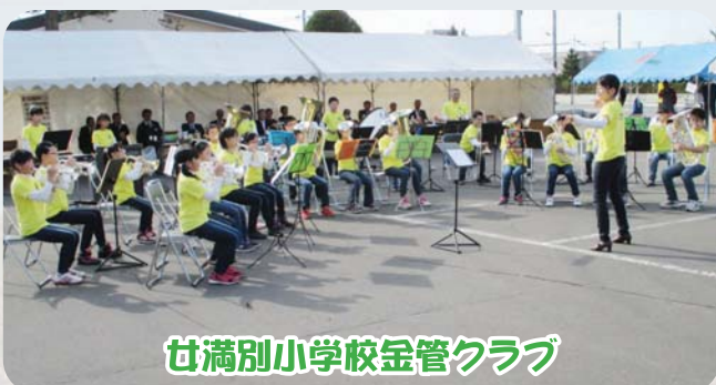
女満別小学校金管クラブ