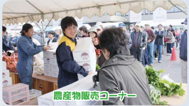
農産物販売コーナー