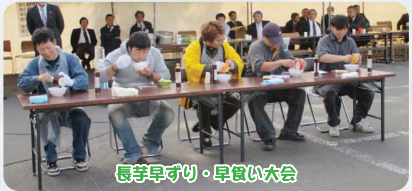
長芋早ずり・早食い大会