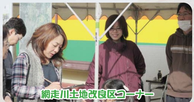
網走川土地改良区コーナー