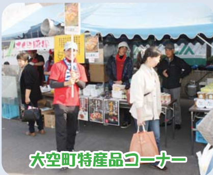
大空町特産品コーナー