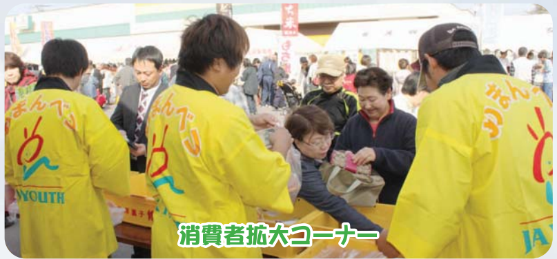
消費者拡大コーナー