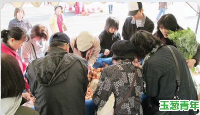
玉葱青年部コーナー