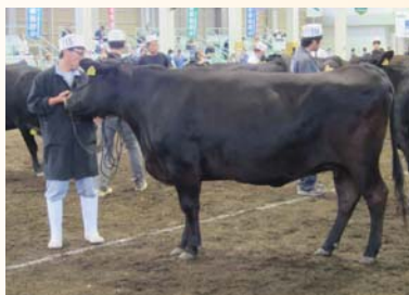
7部【たかきたしげ号】