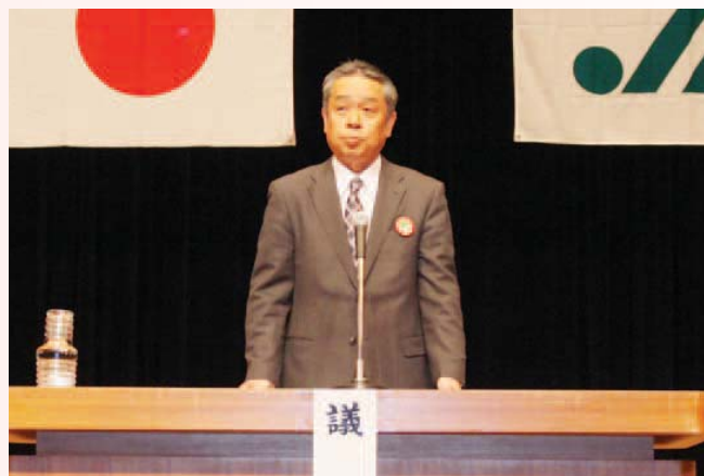
真鍋職務代理理事