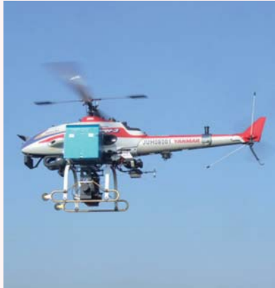
データ収集用ラジコンヘリ