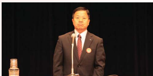
小松職務代理 TPP反対決議表明